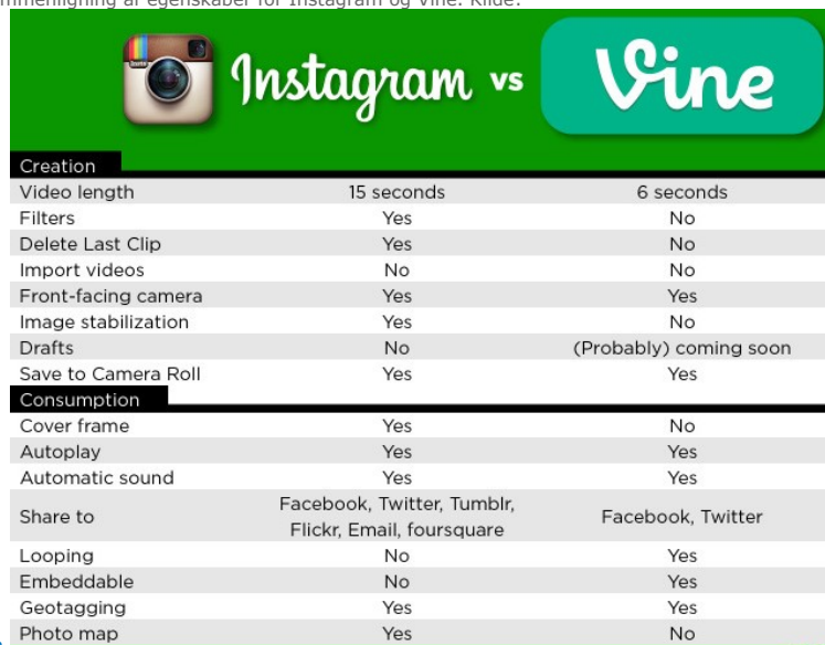
Tabel 1. Sammenligning af egenskaber for Instagram og Vine.